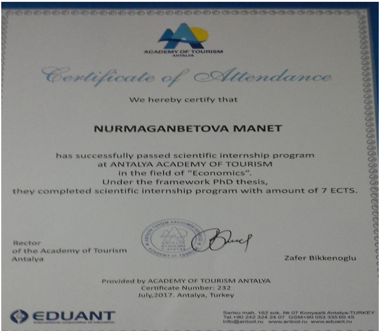
Түркияның Анталия қаласындағы Туризм академиясында ғылыми тағылымдама сертификаты