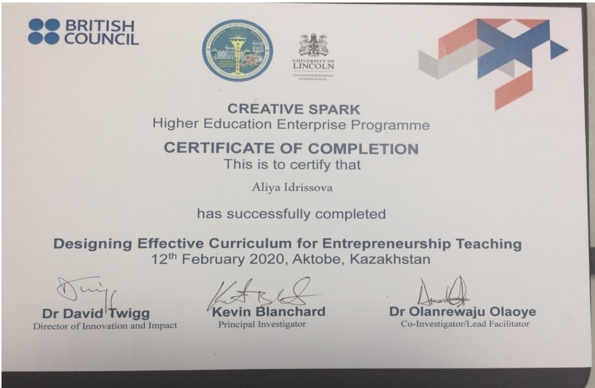
Линкольнск университетімен бірлескен жобасына қатысқаны үшін Сертификат (Ұлыбритания)